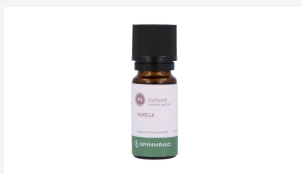
Parfümöl Vanille, 10 ml