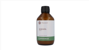
Kokosöl, raffiniert, 250 ml