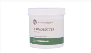
Kakaobutter, 50 g