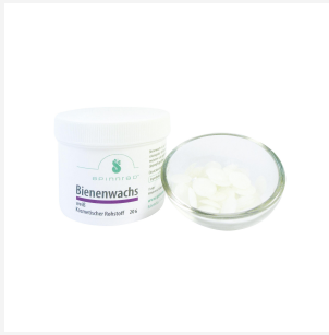
Bienenwachs weiß, 20 g