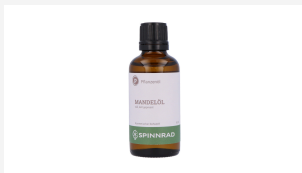
Mandelöl süß, kalt gepresst, 50 ml